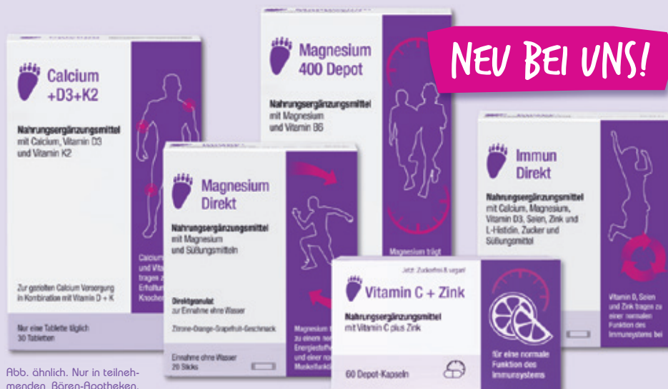
Abb. ähnlich. Nur in teilnehmenden Bären-Apotheken.